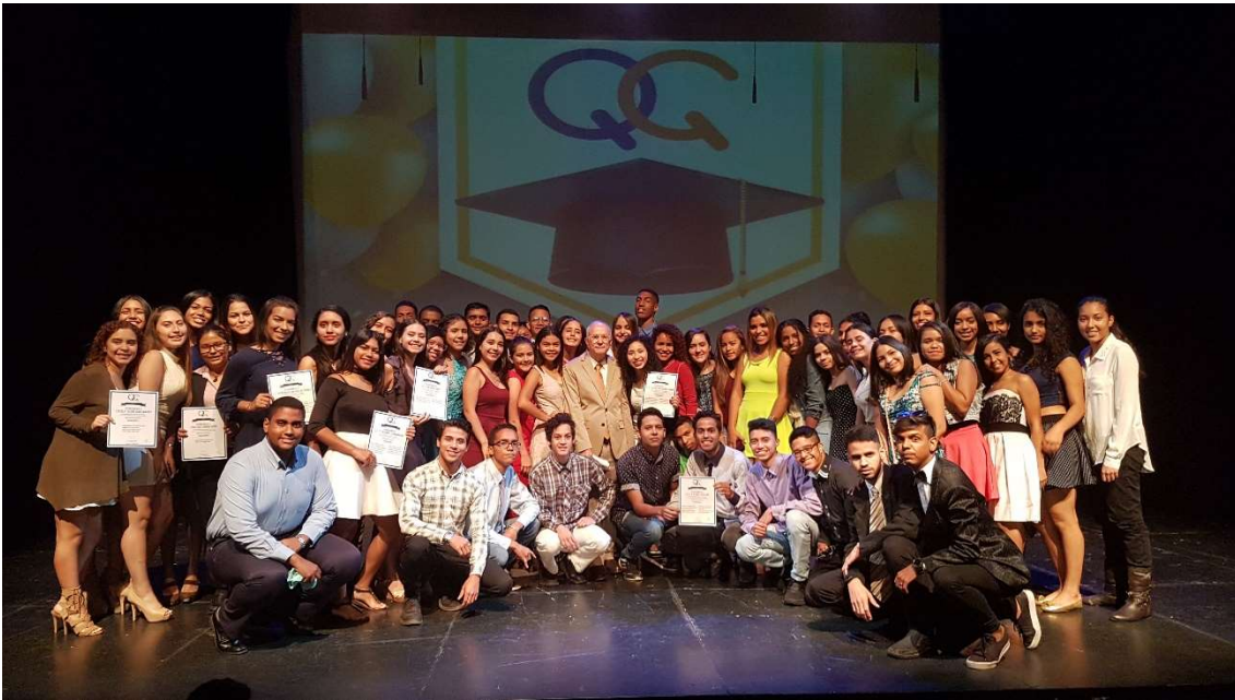
Colegio Fe y Alegría La Rinconada